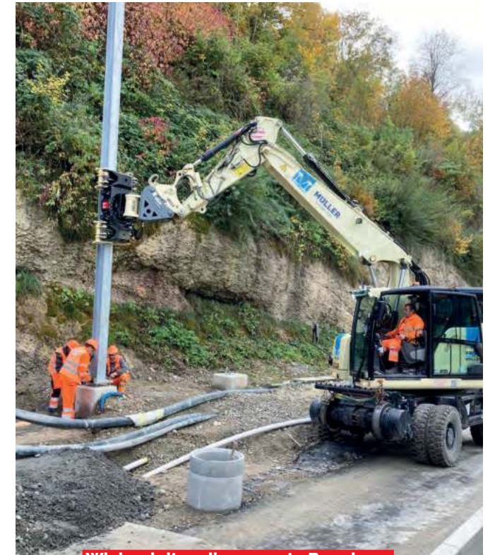
Wir begleiten die gesamte Bauphase