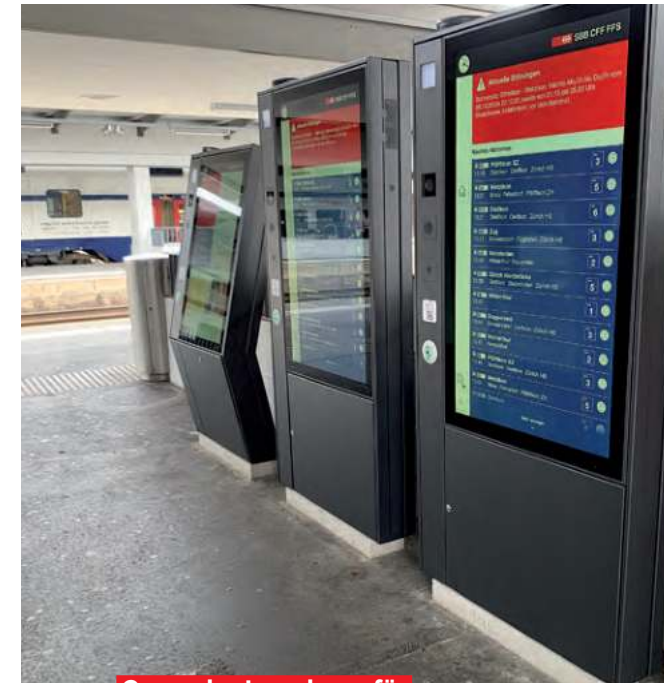
Generalunternehmer für «Smart Information Displays» (SID) der SBB AG