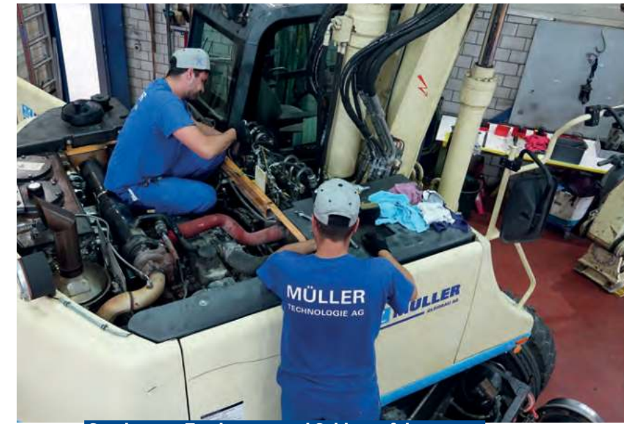
Service von Zweiwege- und Schienenfahrzeugen