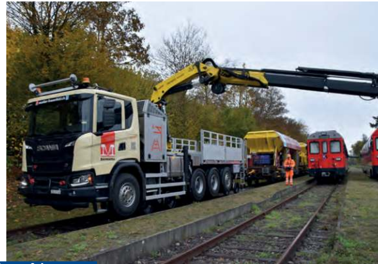
Entwicklung und Bau von Zweiwege- und Schienenfahrzeugen