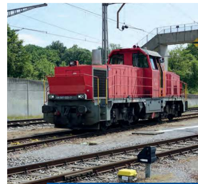
Aufarbeitung und Modernisierung von Lokomotiven